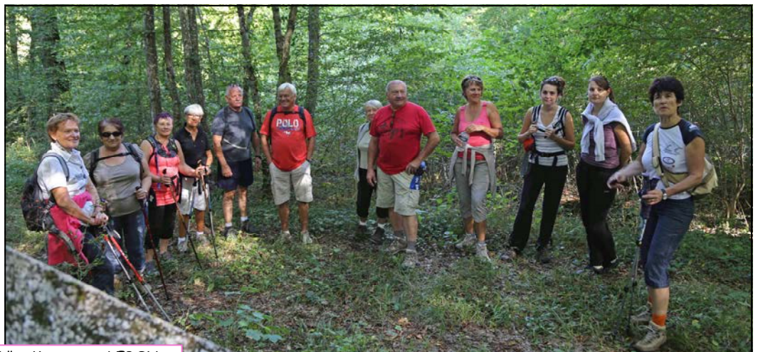
"ML" = Monument LEBON