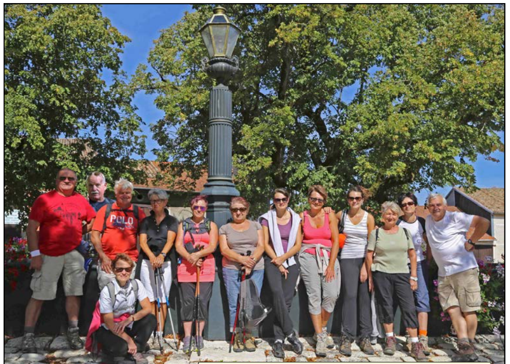
Foto de groupe des 13 randon'aires, devant cette belle fontaine fleurie