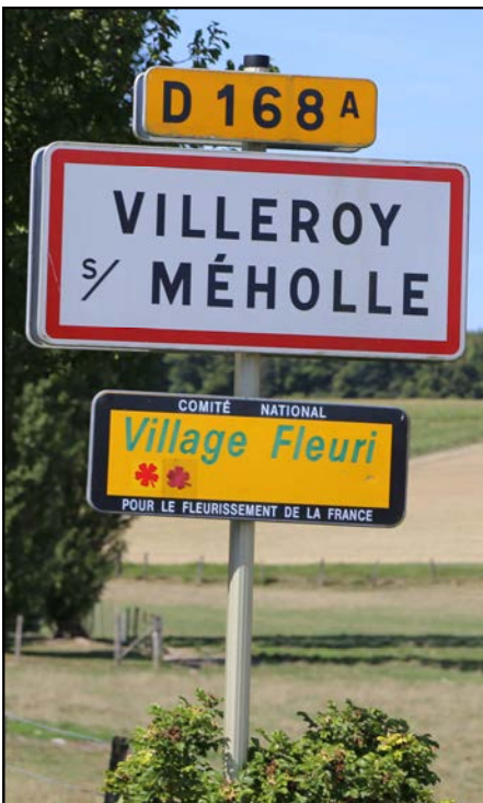
Village fleuri à **

(1) Panama : Ce terme vient, du fait que les conducteurs des chevaux halant les péniches, portaient un chapeau de paille, genre "Panama". Les maisons écurie, des sociétés de halage, seront, elles aussi, dénommées "Panama".