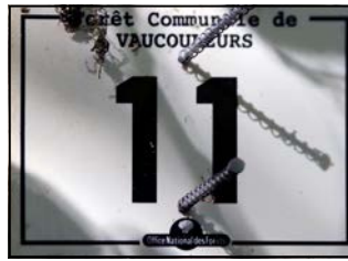
Pause au PK 4,1