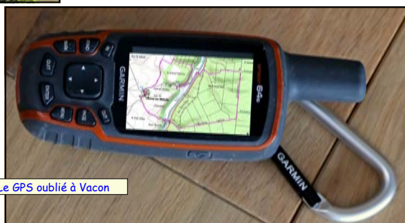
Le GPS oublié à Vacon