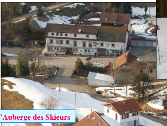
L'Auberge des Skieurs