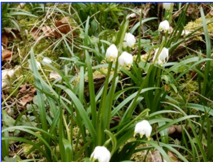
Un tapis de Nivéoles de printemps (leucojum vernum)