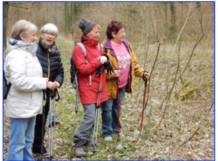
4 autres fleurs, non recensées dans le règne végétal ...