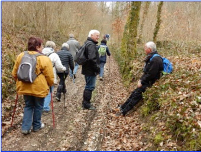
"ça monte, ça descend et ça remonte"