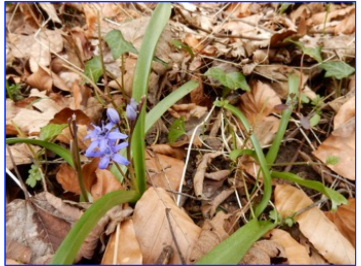
Un tapis de scilles à 2 feuilles (scilla bifolia)