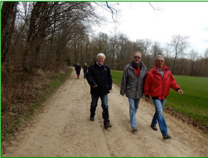
Chemin faisant ... vers la "Bojotte".