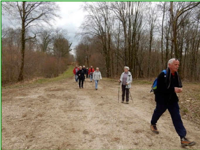
"La Grande Longtaine" en forêt domaniale de Ligny.