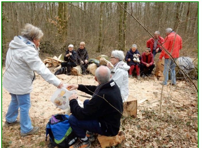
Pause chocolat, assise (MF n'est là).