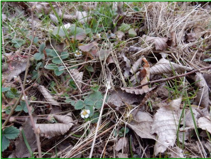
Déjà des fraisiers en fleurs ...