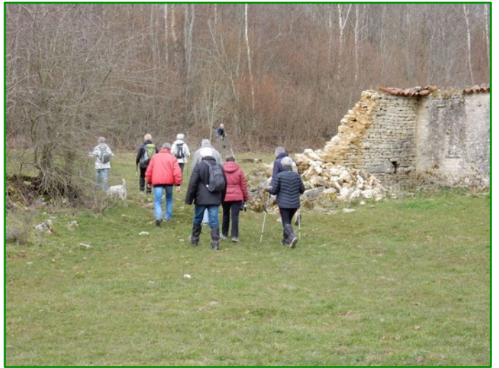
Ancienne ferme de la "Grande Ferté".