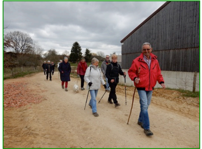
Exploitation en pleine rénovation