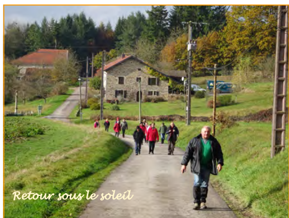
Retour sous le soleil

- 1 bain avec insufflation de gaz thermal : De fines bulles de gaz prélevé aux griffons des sources sont insufflées dans l'eau du bain. L'imprégnation générale de l'organisme par les principes actifs thermaux favorise la dilatation artérielle périphérique et les échanges percutanés.