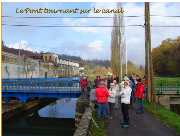
Le Pont tournant sur le canal