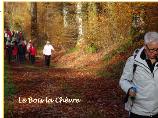
Le Bois la Chèvre