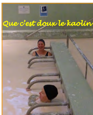
Que c'est doux le kaolin