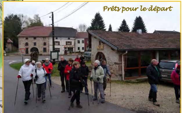
Prêts pour le départ

On s'est dérouillé les jambes et « thermalisés » comme cela.