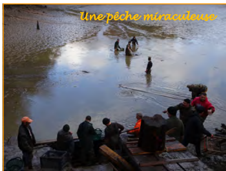
Une pêche miraculeuse

route forestière. Nous quittons la forêt avant de rejoindre les Etangs et la ferme aquacole. Grosse