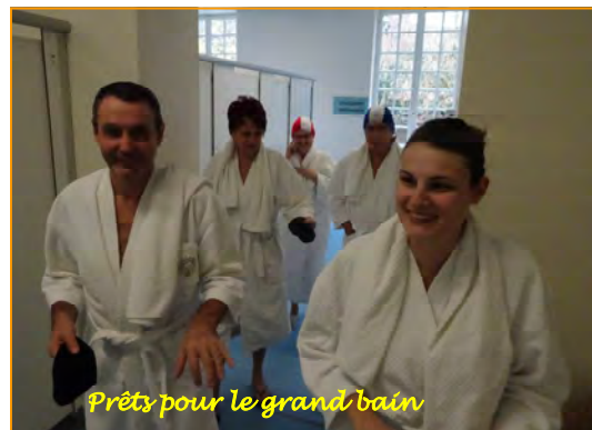
Prêts pour le grand bain

vice sympathique et le café offert. Et, à 14 h.30 nous partons pour les Thermes de BAINS-LES-BAINS. Nous avons droit à 4 soins (détail ci-dessus).